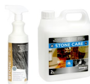
STONE SHINE / STONE CARE